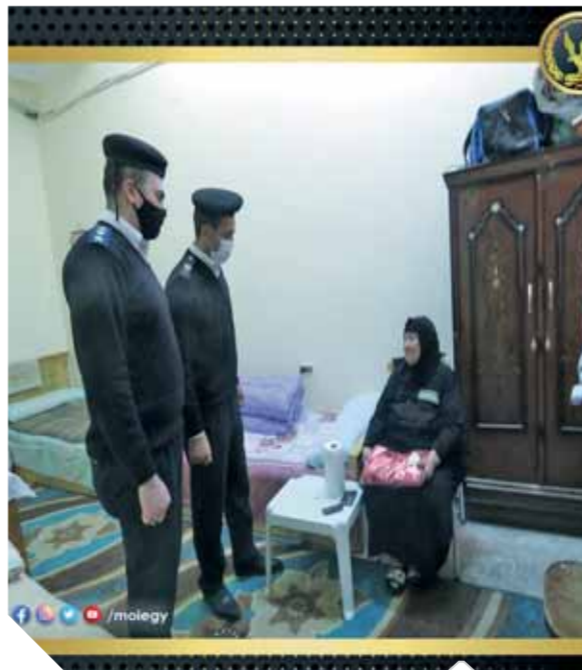
ماموريات لزيارة عدد من دور الرعاية