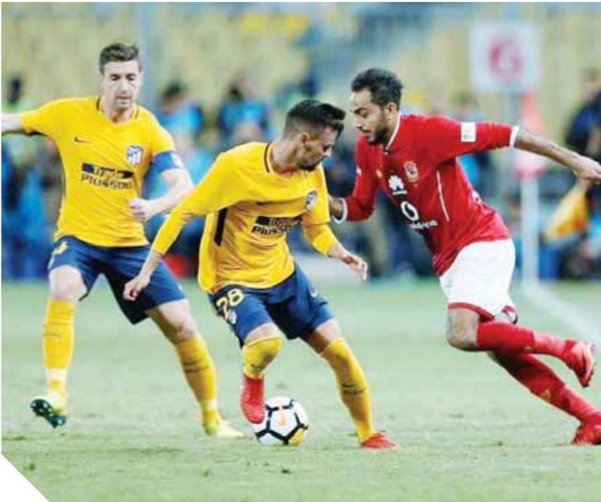
الأهل فاز ودياً على فريق الشباب