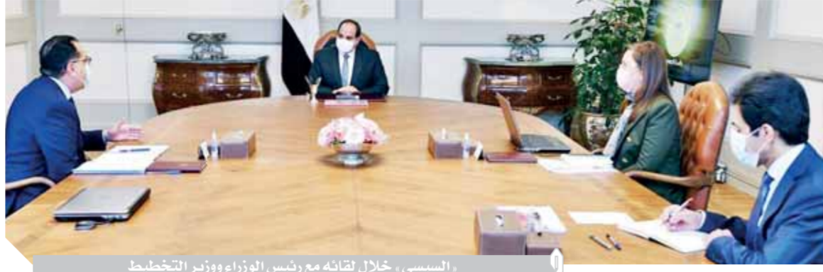
السيسى، خلال لقائه مع رئيس الوزراء وزير التخطيط

تغلبت على ٣٠ مليون سيدة، إلى جانب توجيه الاستثمارات العامة تجاه المشروعات الخضراء، فضلا عن تعزيز قدرات مؤسسات الدولة على مواجهة تداعيات جائحة كورونا، عبر زيادة قدرة المنشآت الصحية، وقد وجه الرئيس بالتوسع فى حياة كريمة، نظراً للمردود البيئي والاقتصادي للمشروع ومساهمته فى توفير مياه الري وزيادة الإنتاجية الزراعية.