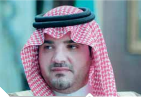
الأمير عبد العزيز بن سعود

مصر العربية، وتمنياته بأن يظلم مجلسكم المقرر بإنجاز المهام الكبيرة الملقاة على عاتقه، داعياً المولى - عز وجل - أن يتم أعمال هذه الدورة والتوفيق والنجاح.