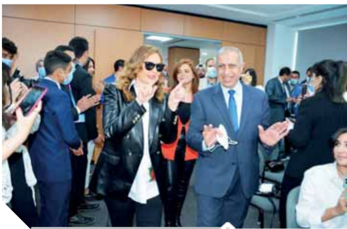
جانب من حفل التكريم